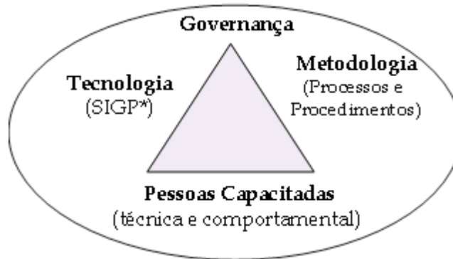
Figura 1: Pilares do Gerenciamento Profissional de Projetos Fonte: Norberto Almeida, 2011

A Portfolio Expert atua nos pilares fundamentais do gerenciamento profissional de projetos, programas e portfólio: Pessoas Capacitadas, Metodologia, Sistema de Informações de Gerenciamento de Projetos (SIGP) e Governança.